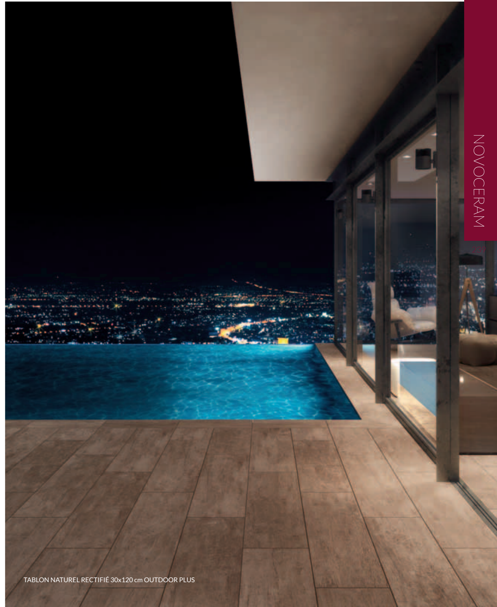
TABLON NATUREL RECTIFIÉ 30x120 cm OUTDOOR PLUS