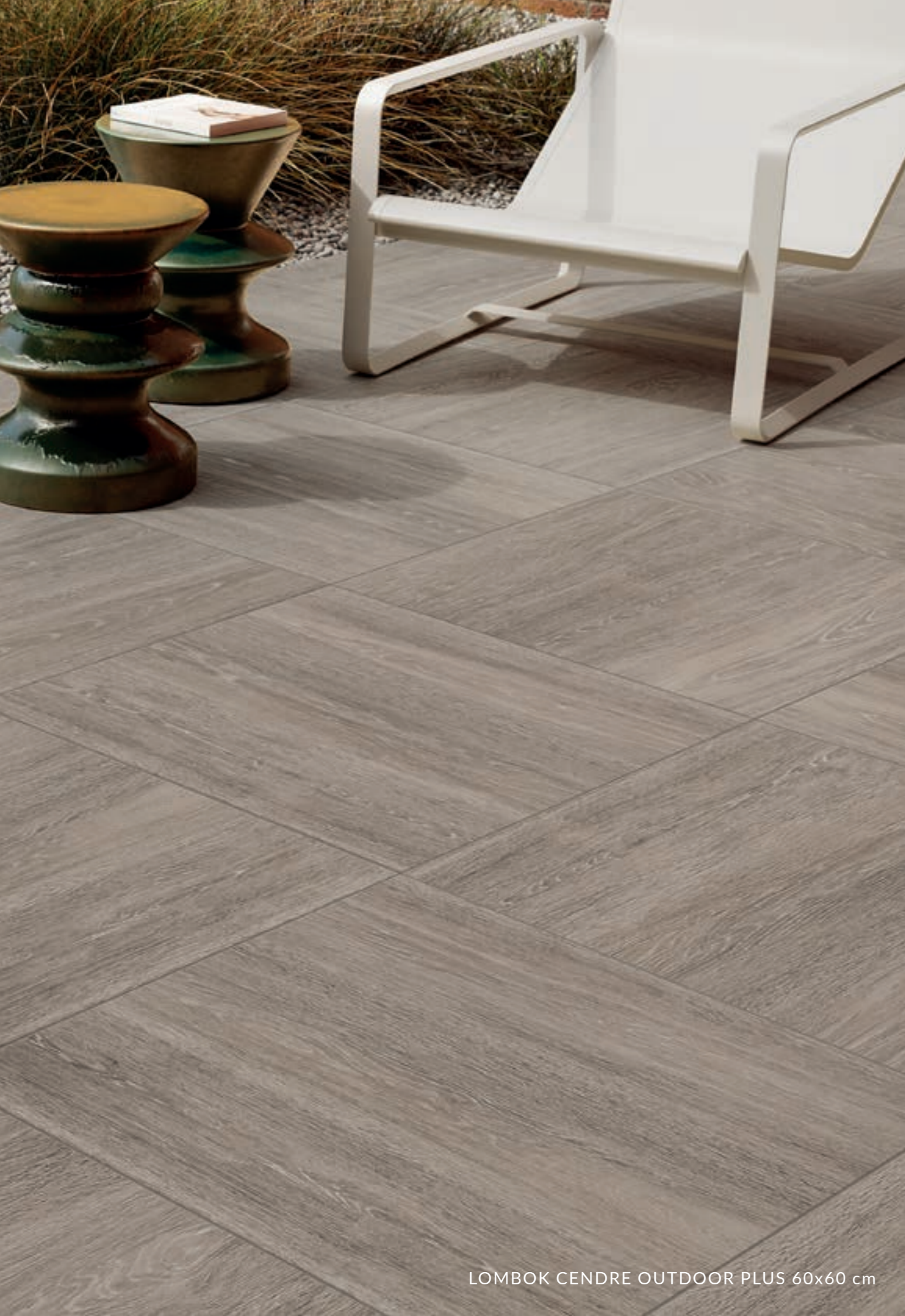
LOMBOK CENDRE OUTDOOR PLUS 60x60 cm