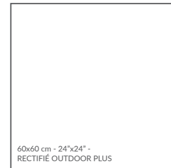
60x60 cm - 24"x24" - RECTIFIÉ OUTDOOR PLUS