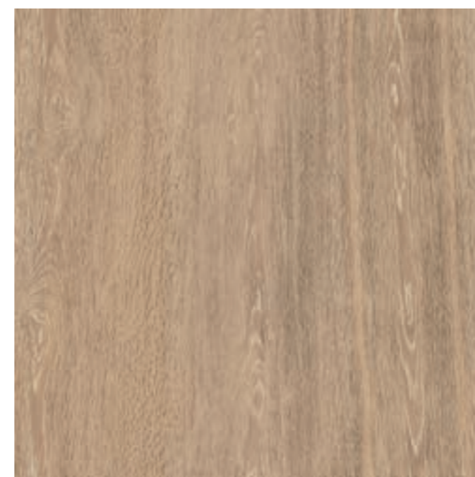
60x60 cm 24"x24" RECTIFIÉ OUTDOOR PLUS J828 UPEC EN COURS