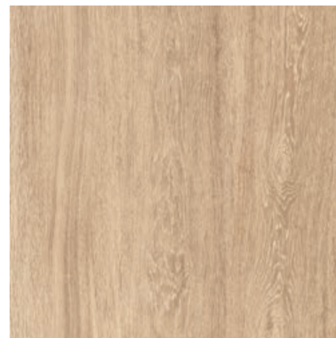
60x60 cm 24"x24" RECTIFIÉ OUTDOOR PLUS J827 UPEC EN COURS